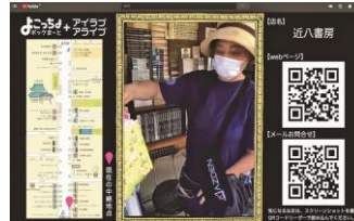
WEBを活用したハイブリットイベント