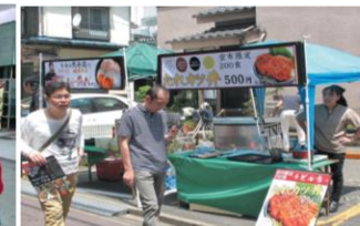
まちバル・グルメイベント