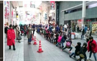
地域体験イベント