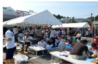
復興イベント・祭り