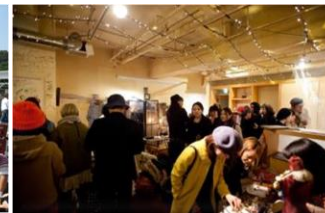
チャレンジショップ