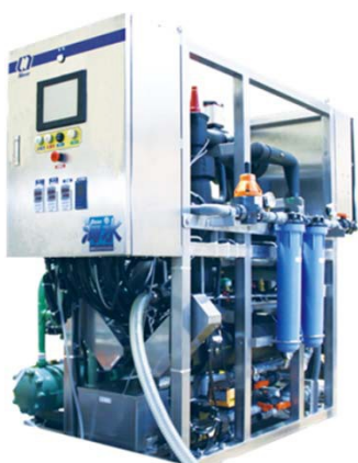
連続式シルクアイス® システム『海氷』