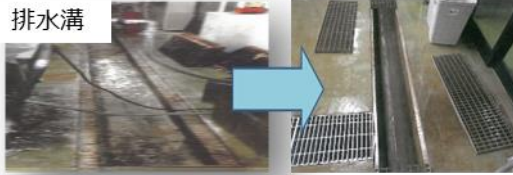
排水溝 施設の衛生管理の強化に向けた排水溝、床、壁等の改修