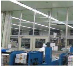
空気を經由した汚染の防止設備 (パーティション) の導入

施設整備と一体 となつてその効果を一層高める ために必要な費用 (コンサル費等)