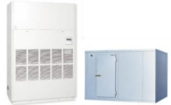
温度管理を要する装置・設備の導入