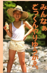
テレビCMで 村も有名に