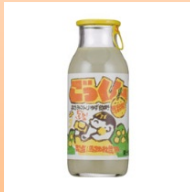
ゆずドリンク 「ごっくん馬路村」