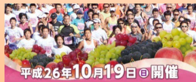
ゴール後にワインが提供される 「甲州フルーツマラソン大会」