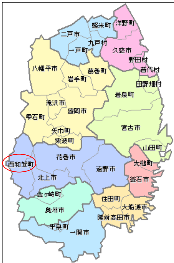
図表-1 西和賀町の人口

平成26(2014)年の日本創成会議による提言では、本町は岩手県内の市町村の中で人口減少率が最も大きい割合になることが予想されており、消滅可能性の高い自治体として名前が挙げられている。人口に占める高齢化率も増加の一途をたどり、岩手県内一高い割合なっていることから、人口問題に関する対策が町の一番の課題となっている(図表-1)。