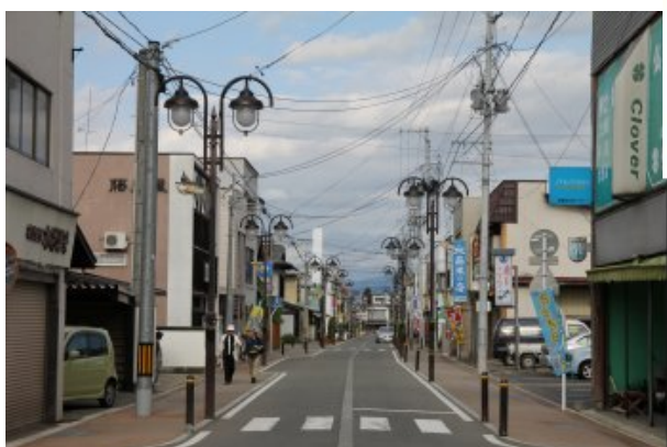
↑ 左澤中央通商店街