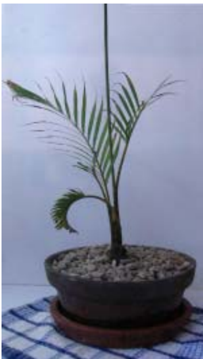
左図： （試験見本） スーパーハイドロカルチャ焼き「鉢」