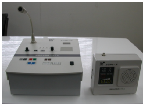
遠隔放送卓と戸別受信機