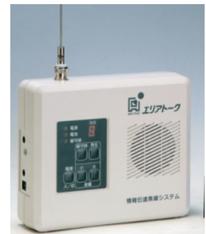
遠隔留守録機能付戸別受信機