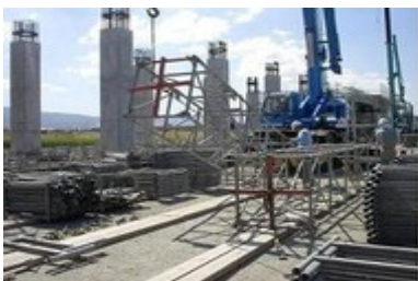
組立用クロスハンガー