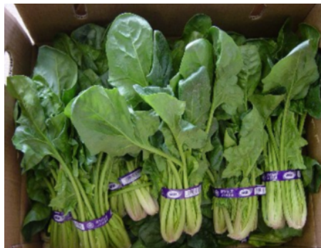
Mist Cool:72h保管後のほうれん草