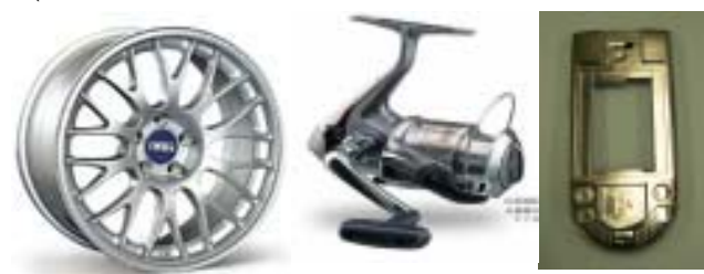
(高度表面処理を施したマグネシウム製品のイメージ)