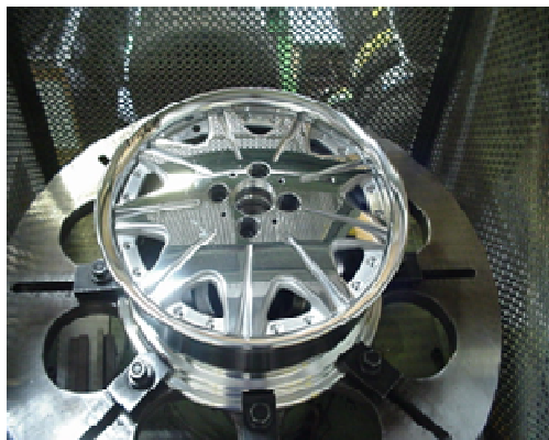
回転曲げ疲労試験