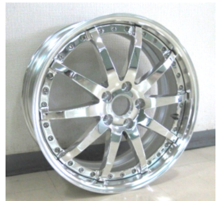
アルミホイール(完成品)