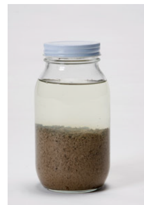
集塵後に凝集剤により水と分離