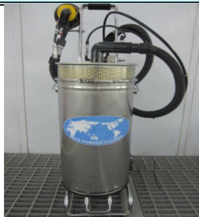
ポータブル塗装粉塵処理装置の概観