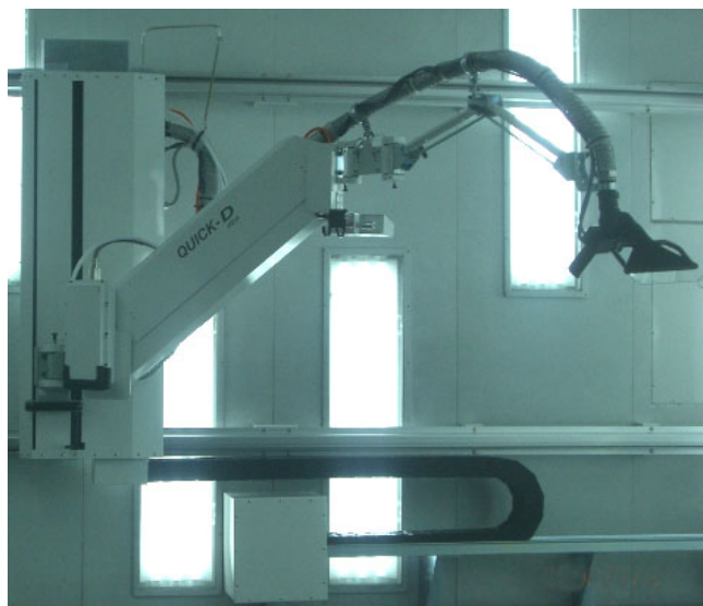
水性塗料乾燥機(QDA - 1)