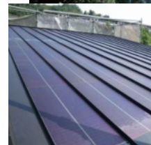
フレキシブルアモルファスシリコン太陽電池