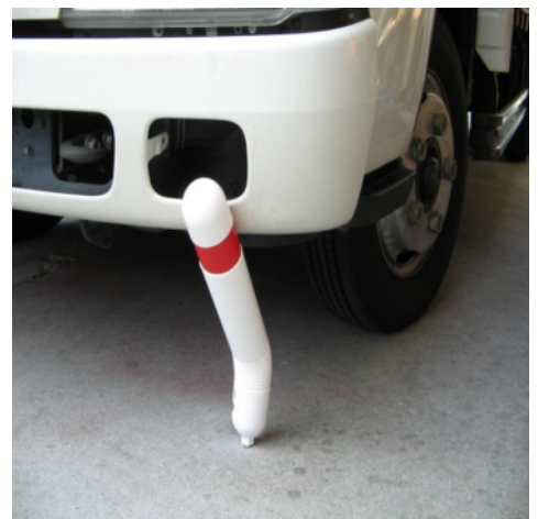
車両との接触の例