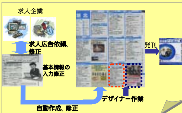
RPSの基本的な仕組み