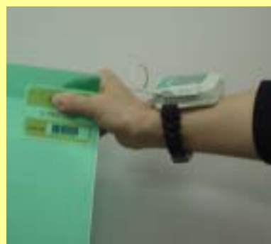
ウェアラブルRFIDリーダー