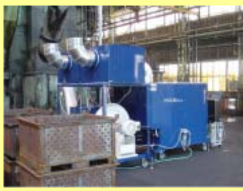
装置概観(吐き出し口側)