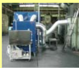
装置概観(側面から)