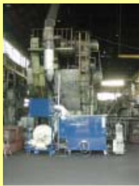
鍛造機に装着された装置