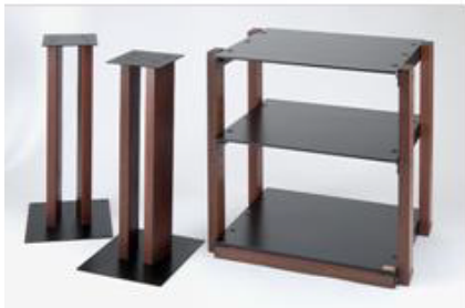
スピーカースタンド