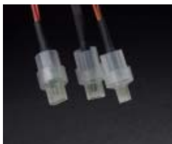
(電気化学測定用セルと電極を組み合わせたバイオセンサ)