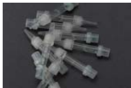
(密閉型スティックと電極を組み合わせたバイオセンサ) (形状等の検証を経て販売予定)