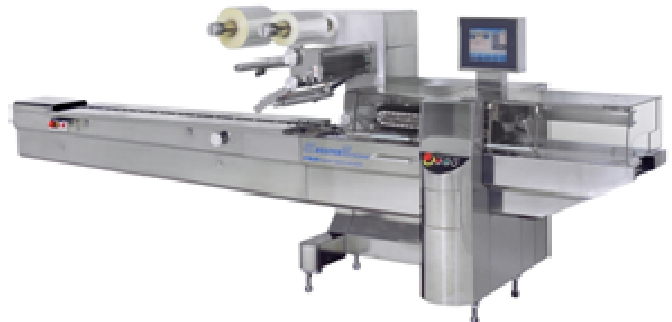
自動横ピロー包装機