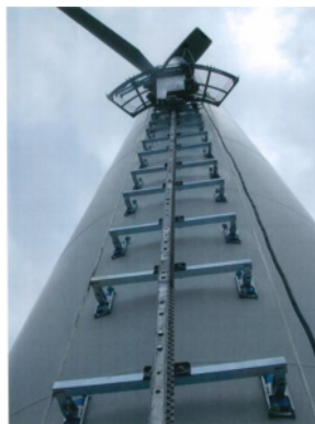
風力発電タワーのメンテナンス