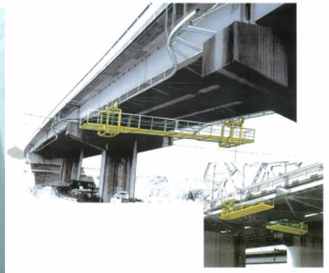
橋脚メンテナンスのイメージ図