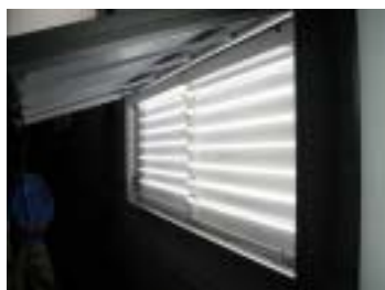
NFL 蛍光灯 看板内設置写真