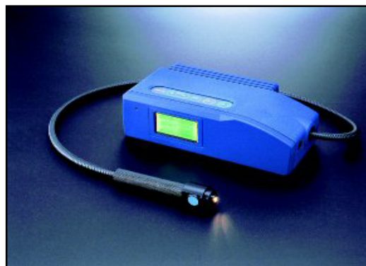
「ウッドスキャン」試作機