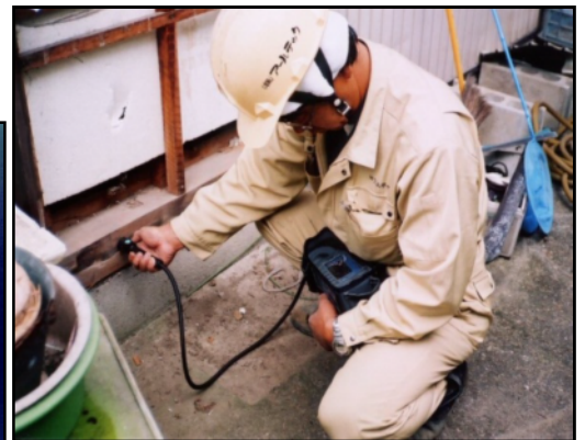
解体現場での作業の様子