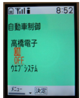
エンジン制御画面