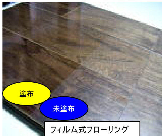
フィルム式フローリングのフロアマニキュア 塗布(左)/非塗布(右)