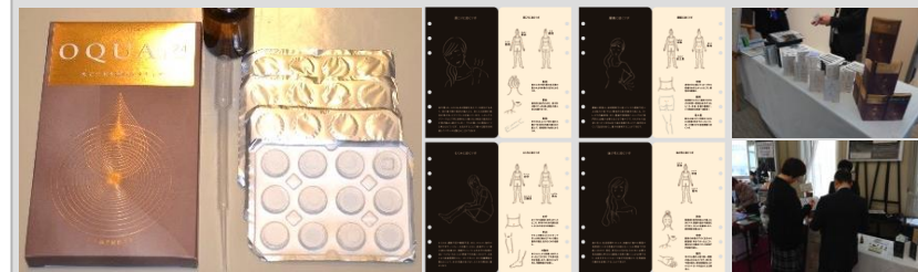
図 顧客評価に用いたパッケージ等のサンプルと展示会での評価の様子