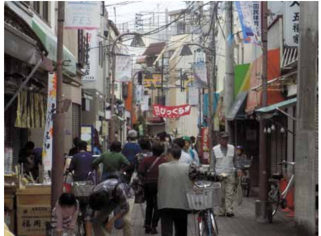
地域に根付いた下町の商店街

商店街を地域の特性である「下町コミュニティ」の核として改めて位置づけ、近代化を進めることによって再生を図るべく、平成元年度の東京都コミュニティ商店街事業の申請を行った。これを機に、ハード・ソフト両面に