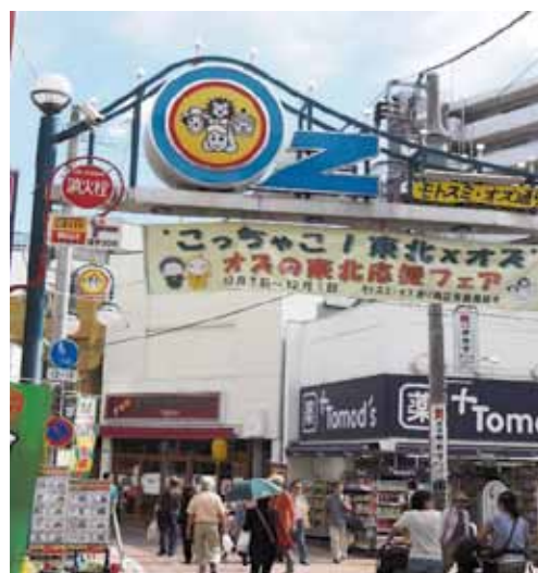
商店街入り口のゲート

まず、活動の方向性を明確にする「商店街活動指針」を作成し、会員への配布、非会員の加盟促進に役立てた。また、イベント等事業では近隣学校と連携し、地域コミュニティの核として活躍するとともに、携帯メルマガ、twitter によるクーポン券の発行や、安全安心事業として「一店一安心運動」、「ラジオ、懐中電灯」の配