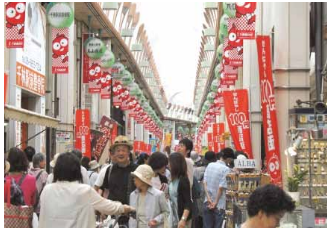
連日賑わいをみせる千林商店街

新たな顧客ニーズへの対応としては、全国商店街支援センターの「平成24年度商店街活性化モデル創出事業」として「1000ピースプロジェクト」を実施、チームを作り、地域の魅力を発掘し、PRすることで、千林ファンを増やすことを目指している。