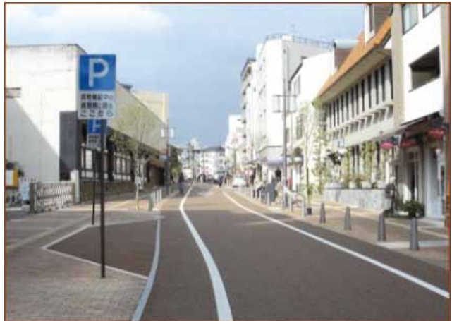
「文化薫る街」として整備された商店街

松山市の進めた「坂の上の雲フィールドミュージアム構想」のセンターゾーンに位置する商店街としての役割を意識し、約10年前に「文化薫る街」として商店街の景観を整備したことで激変。現在では、商店街のコンセプトに同調した新しいテナントが多く出店し、ここ5