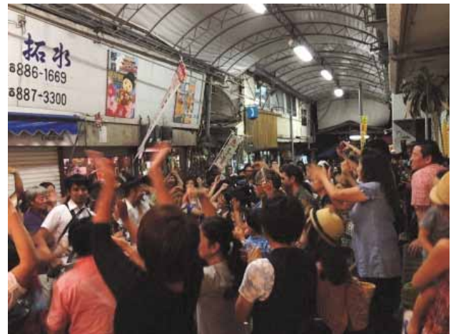
イベントで賑わう商店街

毎年6月～10月の最終土曜日に「栄町市場屋台祭り」と称し、商店街の通路に特設舞台を設け、多数のボランティア参加のもと、音楽・ダンスイベント等のステージを開催。中でも、商店街で商売を営む3人組「おばあ」のユニットがラップのリズムで商店街ソングを披露し、そのユニークな演技が栄町市場を有名にしている。