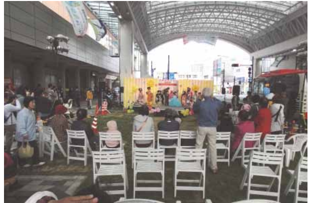
バード・ハットでの子供ファッションショー

安全安心面では、駅前通りアーケード、サンロードアーケードの改修事業、鳥取市との連携による駅前太平線バード・ハットの整備運営、アーケードの全照明LED化、防犯カメラの設置等を実施した。同時にソフト事業