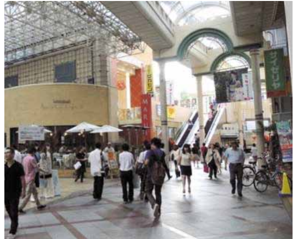
リニューアルした全蓋アーケード

平成20年に「柏二番街まちづくり協定」を制定し、今後改築を必要とするビルが「街の魅力」につながるよう調整するほか、風営法第2条第5項に該当する業種の出店を防止し、更には看板・広告物についても自主規制を設けるなど、街路全体のデザインの統一を図る取組を展開している。ハード面では、今年度、アーケードの天蓋を透明にするとともに照明のLED化を図り、消