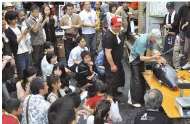
まぐろの解体ショー

関連URL： http://matsue-shinoohashi.jimdo.com/