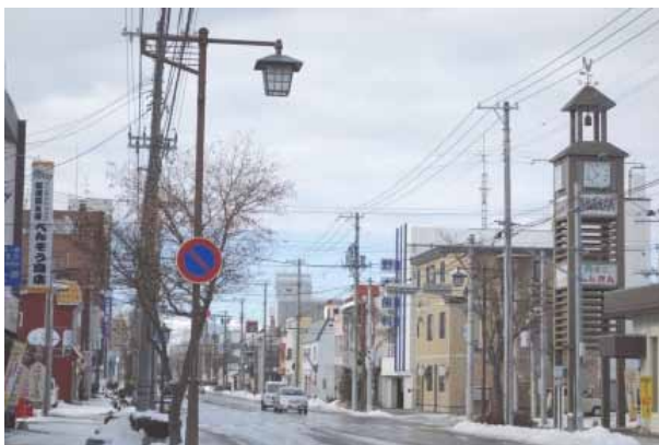
昭和の風情を残す電信通り

当商店街は地域住民及び来街者に対しニーズ調査(136サンプル)を実施。空き店舗の増加から商店街としての認知度が低下していることを認識するとともに、当