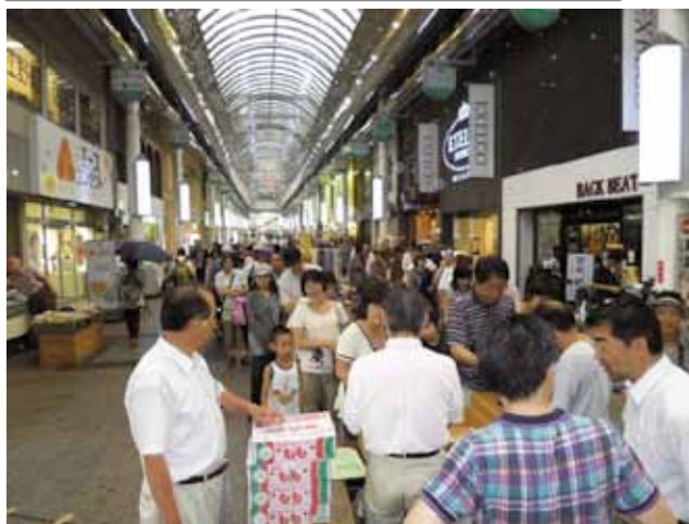
オリオンバザール(フリーマーケットと抽選会)