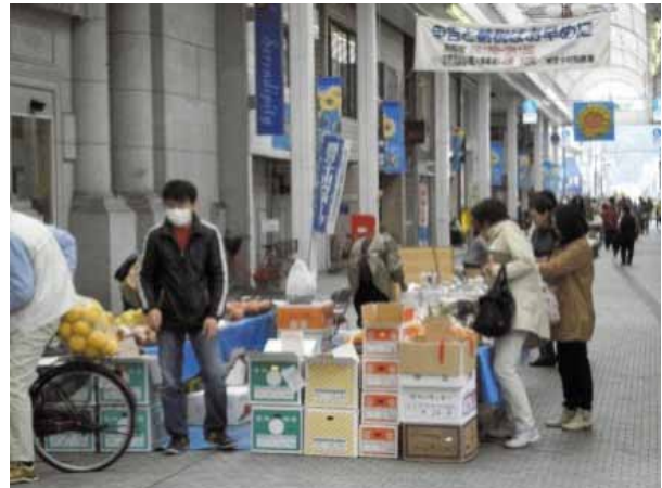
四万十市唯一のアーケード街

チャレンジショップ事業は、県西部の広い範囲で新規創業希望者を募り、チャレンジャーの育成をきめ細かく行うとともに、中心商店街の空き店舗データを写真