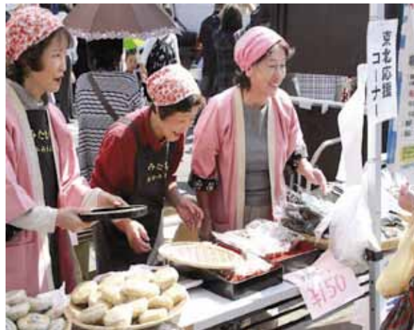
「みたまちおかみさん会」の活動風景