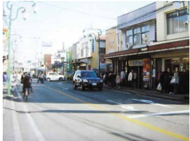
御殿場駅近くに位置する商店街

具体的には、専従者2名を雇用し、御殿場市内を中心に、注文を受けた商品の宅配と、荷物の持ち運びも