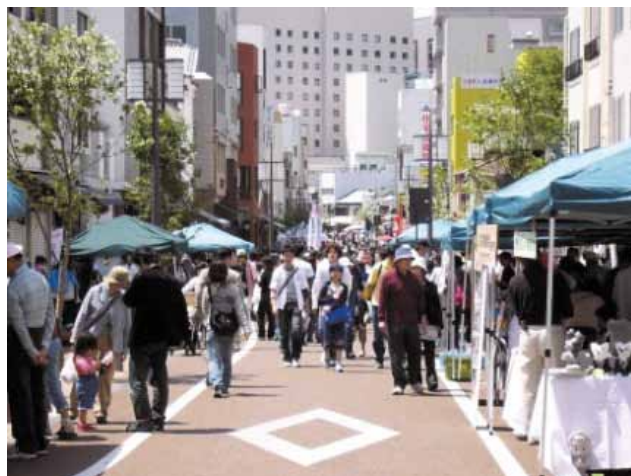
観光客で賑わう商店街