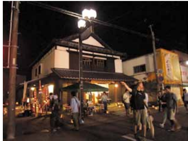
商店街の活動拠点「たかなべ町家本店」

昼は芸術作品として、夜は灯りをともし灯籠の役割を持つ灯籠を設置する「あかりプロジェクト」。