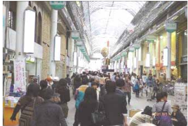
「宮の市」開催中のアーケード街

平成22年度に経済産業省の補助金を活用してアーケードを改修。明るくなった商店街の空き店舗を活かし