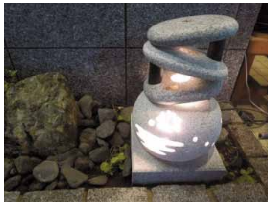
「あかりプロジェクト」の灯籠

http://www.puraccho.jp/modules/myalbum1/photo.php?lid=26