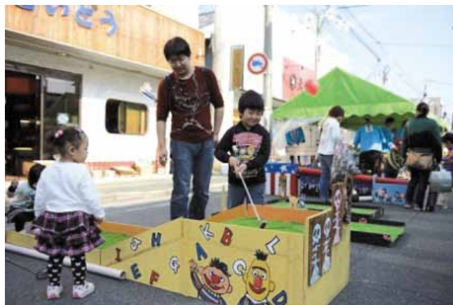
子供たちにも安心・安全な遊び場を提供