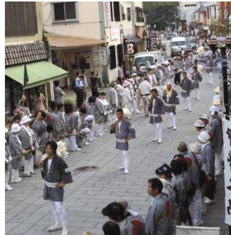
「外宮参道」に改名した商店街

地元の商店主に伊勢神宮に関する理解・知識が乏しく、来街者へのおもてなしが不十分であった現状を踏まえ、神宮に関する理解の増進が重要である点を共有化した。また、昭和40年代以降、内宮だけの「片参り」が増えたことが内宮と外宮の参拝者数の格差を広げ、外宮参道の衰退を招いたことから、「外宮先拝」の重要性を内外にアピールし、平成19年には通りの名前を