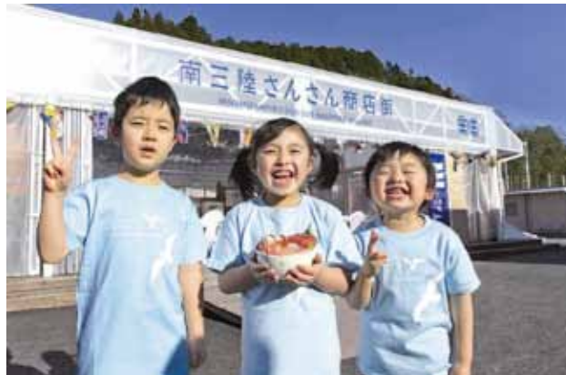
“キラキラ丼”をPRする子供たち

関連URL： http://www.sansan-minamisanriku.com/