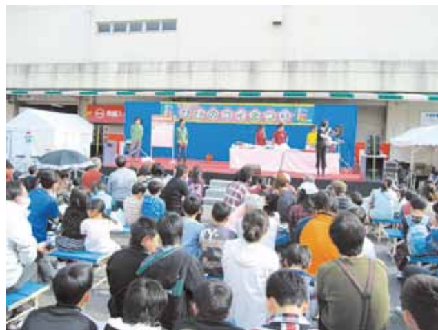
「ひびのコイまつり」