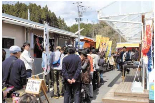
ゼロからスタートした仮設商店街

他の仮設商店街の多くは土地確保の事情から2階建てが多いが、南三陸さんさん商店街では当初から来客の周遊を意識して全て1階建てとした。また、店舗の配置を意図的に不規則とし、店舗の構成についても「飲食店ゾーン」「小売店ゾーン」「暮らしの店ゾーン」に