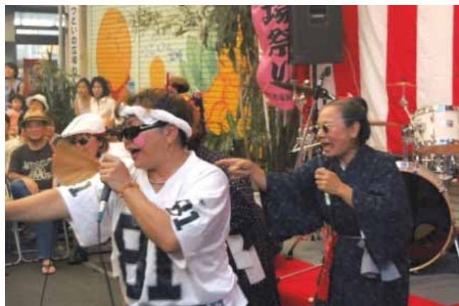
おばあラッパーズのライブ