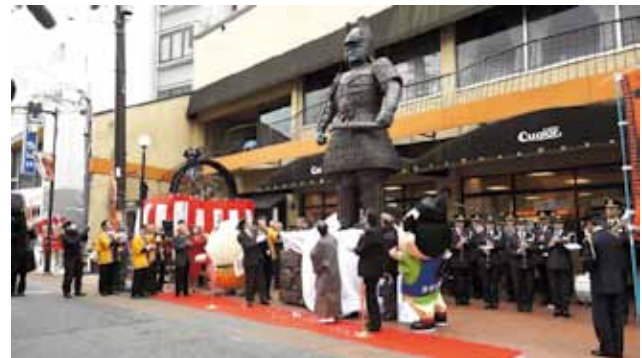
5メートルの大魔神像を大映通りに設置

地域のお母さんの力を商店街の活性化に活かす仕掛けづくりとして、地元のNPO団体と連携し、空き店舗を活用した惣菜と弁当の販売及びカフェを運営するコミュニティスペース「キネマ・キッチン」を開設した。