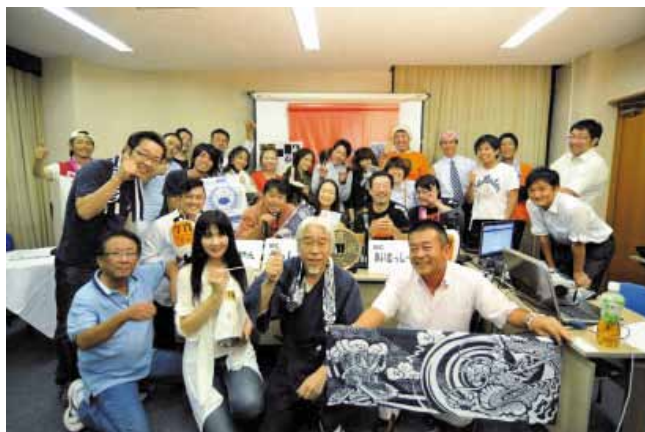
空き店舗を活用した USTREAM 配信スタジオ