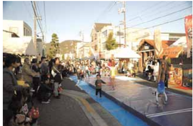
さまざまなイベントが開催される商店街

空き店舗活用プロジェクトでは、空き店舗を様々なコミュニティ団体が利用できる空間に整備。利用する団体によってパブリックビューイング、絵画展、ビアガーデン、物産市などのイベントが開催されている。