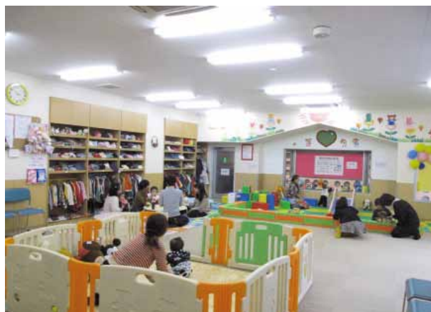
一時託児室「ママトモ魚町」

所在地：福岡県北九州市小倉北区魚町 会員数：93名 店舗数：78店舗 関連URL： http://www.uomachi.or.jp/