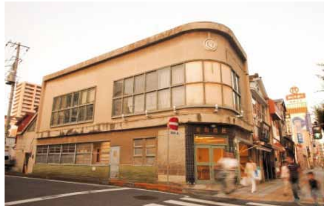
商店街のシンボル「泉町会館」

生鮮食品などが購入できる店舗が中心市街地内で減少し、地域住民の多くが日常の買物に不便を感じて