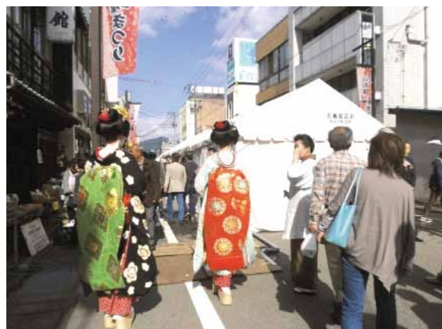
古都の風情を演出