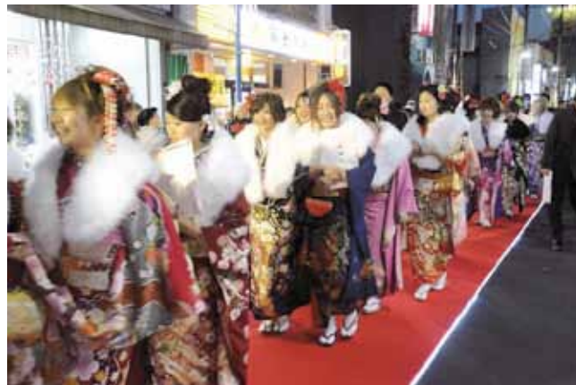
成人式にあわせた「商店街レッドカーペット」