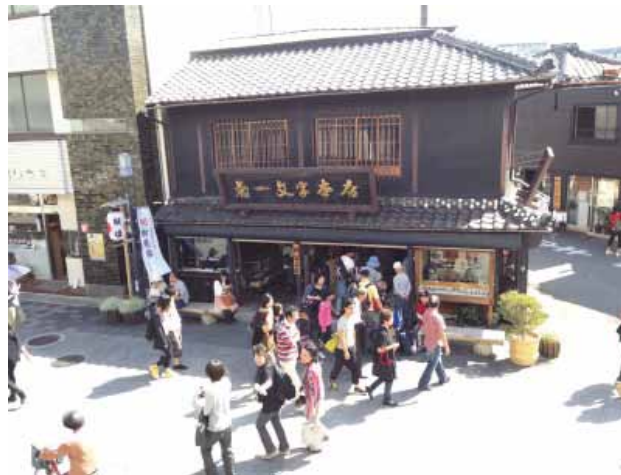
交流拠点「伊勢菊一」

関連URL： http://isekikuichi.com/gekusandou