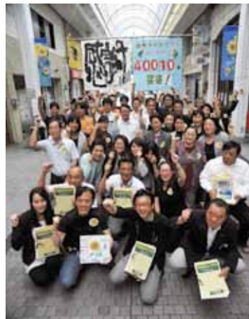
ドラマ続編要望の署名活動、 目標の40010(四万十)を突破