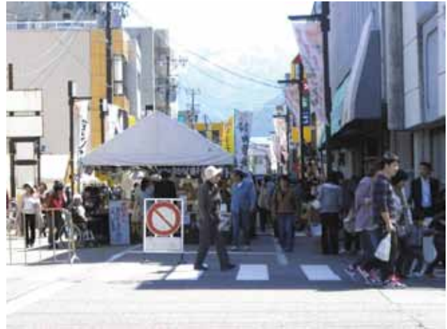
「越前大野 小京都まつり」で賑わう商店街

このイベントは、単なる地方の物産展にとどまらず、平成25年の開催時には、兵庫県篠山市の“丹波黒豆”、