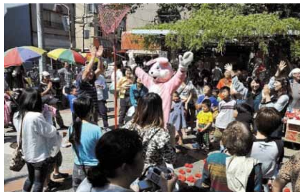
子供たちで賑わう「ちびっ子縁日」