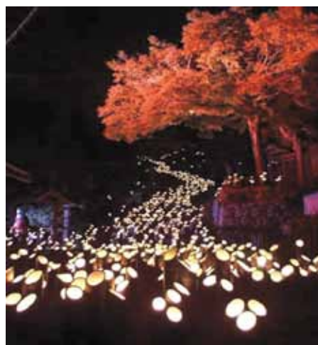
イルミネーション「竹ほたる」で演出

関連URL： http://www.taketan.jp/spots/detail/469