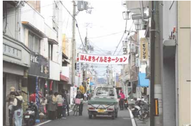
古い町並みを残す商店街

御坊市や御坊商工会議所などが力を入れている観光推進と商店街活性化を繋げるため、「りんこう」の愛称で親しまれている地元ローカル鉄道の紀州鉄道と連携し、鉄道の乗客を対象に商店街でおもてなしする「ご