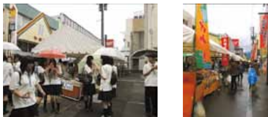
「越前大野 小京都まつり」のテント市

事業の運営に当たり五番商店街では、商工会議所、市と連携し、広報や事業運営の協力を得ている。また、テント市事業では、地元農家、福祉団体、学生などから出店の協力を得ることで、継続的な取組につながっている。