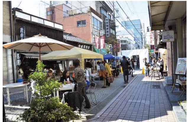
「つくるがある町」がテーマの商店街