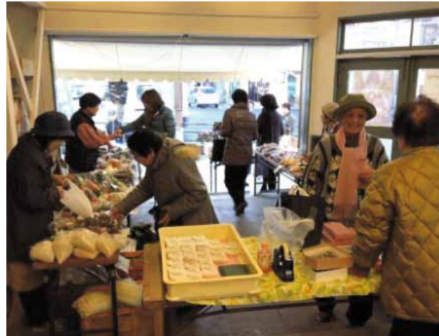
住民に親しまれている「ファーマーズ・マーケット」