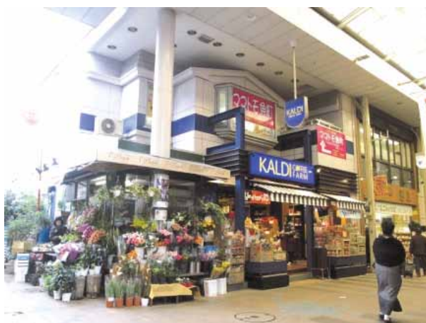
空きビルを再生して開業した賃貸ビル

平成24年度、魚町商店街振興組合と北九州まちづくり応援団(株)が共同で、経済産業省の「地域商業再生