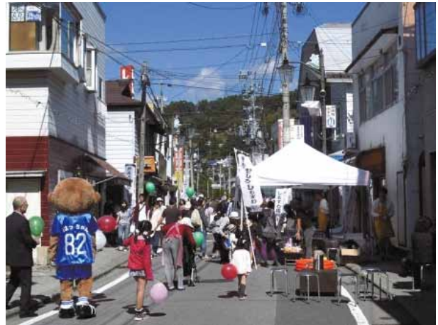
賑わいを取り戻している商店街

15年前に商店街のおかみさん方で結成された「みたまちおかみさん会」と、まちづくりの活性化に取り組む「NPO匠の町しもすわあきないプロジェクト」が連携し、空き店舗を利用した若者の起業支援を行うとともに、