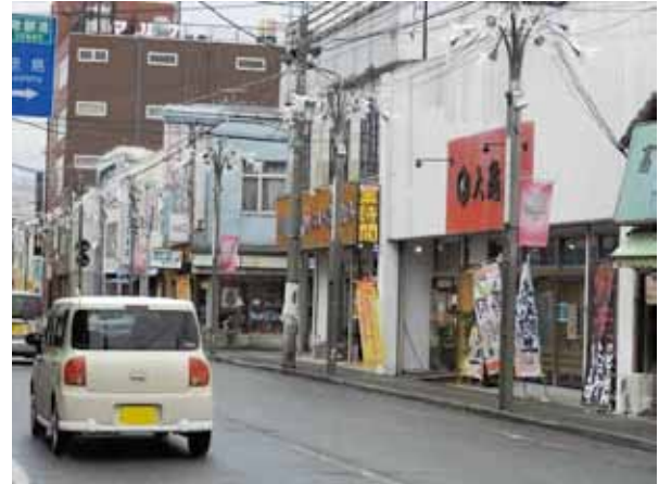
被災避難者受け入れの拠点として整備が進む商店街

ことを受け、避難者を迎え入れる体制づくりのためのNPO法人の設立や、復興公営住宅から商店街への回遊・誘導拠点となる商業集積と居住空間の整備を検討するなど、目に見える町外コミュニティのモデル事例の実現を目指している。