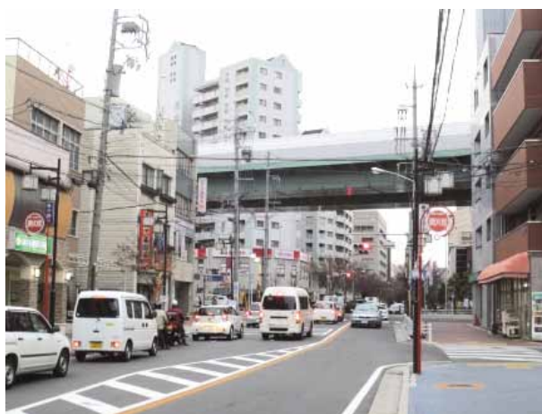
商学連携で活気を取り戻す商店街

平成20年、商店街と名古屋学院大学教職員および学生まちづくりサークル、そして地域NPOが参加する「日比野商店街活性化会議」が発足し、月一回定期例会が開催されるとともに、さまざまな商店街活性化事業へ取組が始まった。学生発案の買い物スタンプラリー「ひびのタウンズ」発行や逸品グルメ事業、大学キャンパス屋上で始まった養蜂で採れた日比野産のはちみ