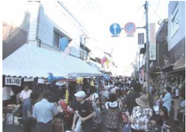
毎年にぎわいを見せる七夕祭り

し、買い物の休憩場所だけでなく、地域のサークル活動・イベント等、交流の場として利用されている。この取組を契機に、空き店舗を活用したアート関係者9人の誘致や飲食店等も12件でき、空き店舗の減少を実現している。また、個店の魅力づくりにも力を入れており、歩いて楽しい、情感のある城下町を目指した商店街を確立している。