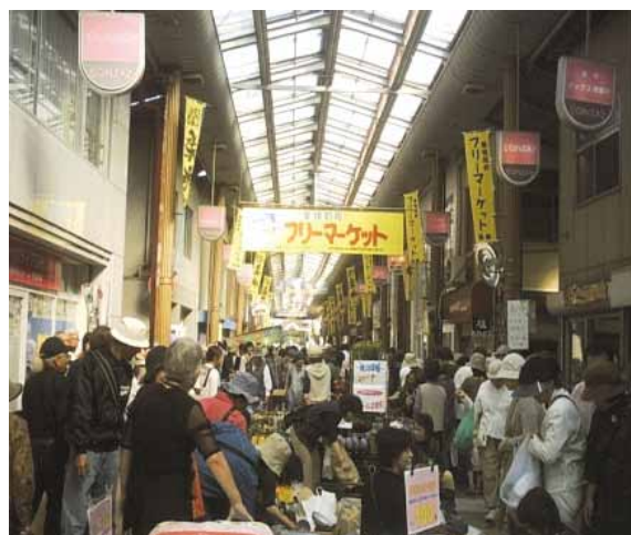
アーケードで開催中のフリーマーケット