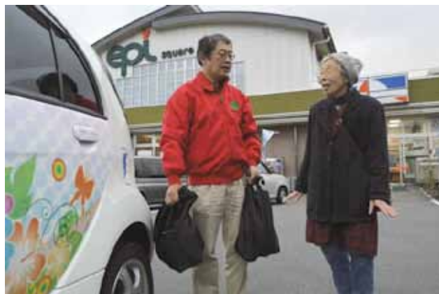
買い物支援を行う「チームMOCO」