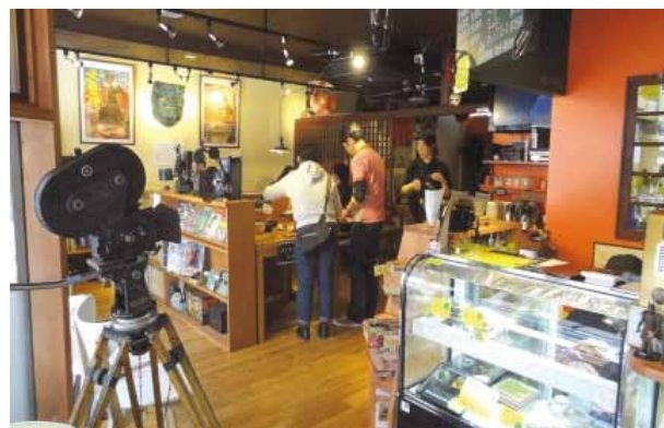
コミュニティスペース「キネマ・キッチン」