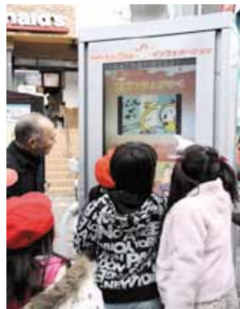
「おずっちょ」に見入る子供たち