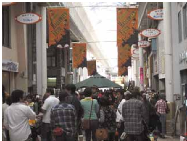
本町2丁目ハロウィンフェスティバル

また、本来の目的である商店街への来街数の増加、売上げの増加につなげられるよう、商店街でしかデータ