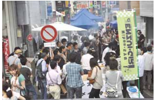
伊勢宮地区で開催された「日本酒のイベントENZUIGIRI」

平成23年に地域商店街活性化計画の認定を受け、アーケード改築や防犯カメラ設置を実施し、誰もが安