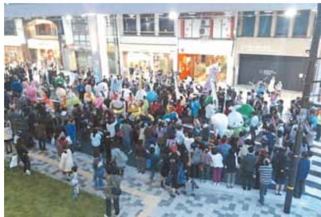
ゆるキャラパレード