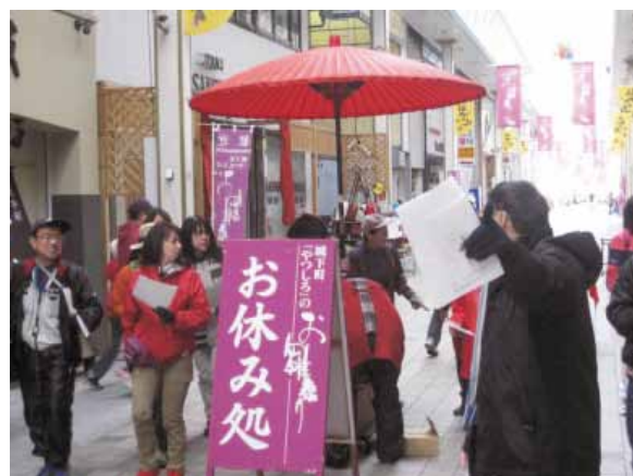
「テクテク歩こう商店街」で健康づくりを支援