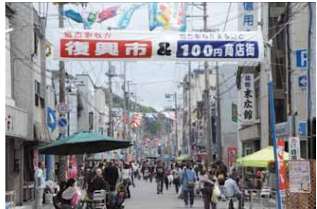
復興を目指し、活気を取り戻す商店街

しかし近年は、「歩道がない・休憩施設が少ない」など必ずしも人に優しいつくりとはなっていない。また、欲しい商品が揃わないことや、若年層・家族連れが興味を引くイベントが足りないこと、イベントの来街者数に比べて来店者が少なく、共同販促事業も必ずしも売上に結びついていないことも課題として残った。