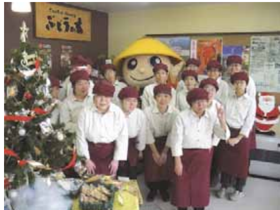
障がい者支援施設「クッキーハウスぶどうの木」