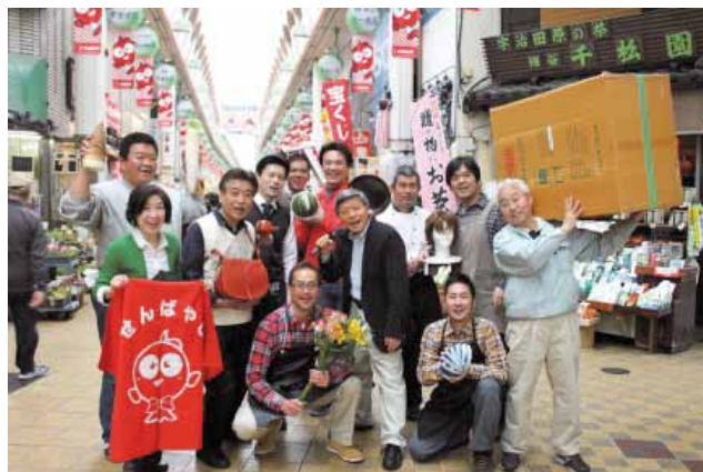
商店街を盛り上げる店主たち