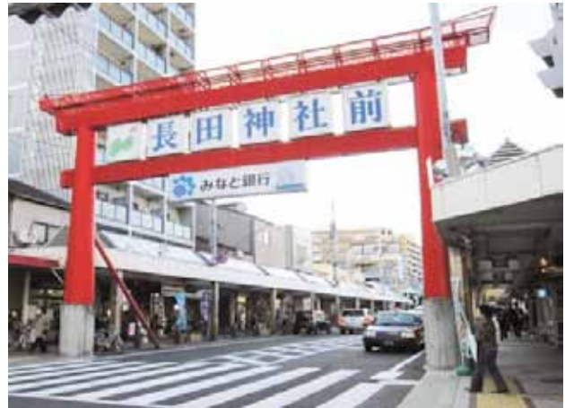
商店街のシンボルの大鳥居

商店街の代表者と小売市場の代表者が幾度もポイントカードシステムの構築方法や既存カードとの差別化について議論を重ね、オーダーメイドのシステム構築を実現した。助成金の活用等によりコスト面での課題