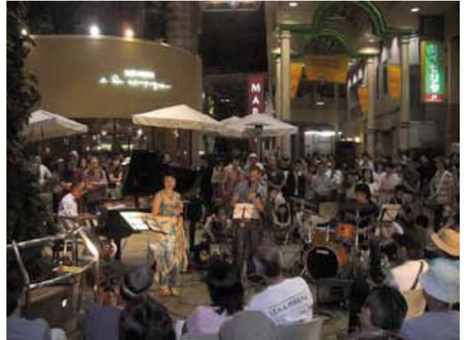
商店街をステージとした「アートラインかしわ」