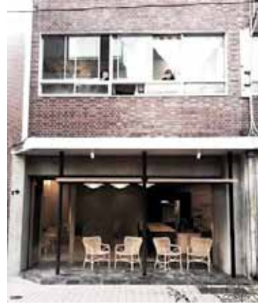
「まちでつくるビル」