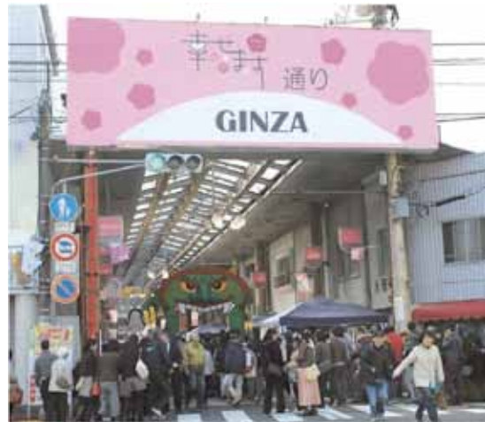
商店街の愛称「幸せます通り」

現在では、この取組を更に進化、発展した形として、高校生と地元若手店主が共同企画して販売する「ホ