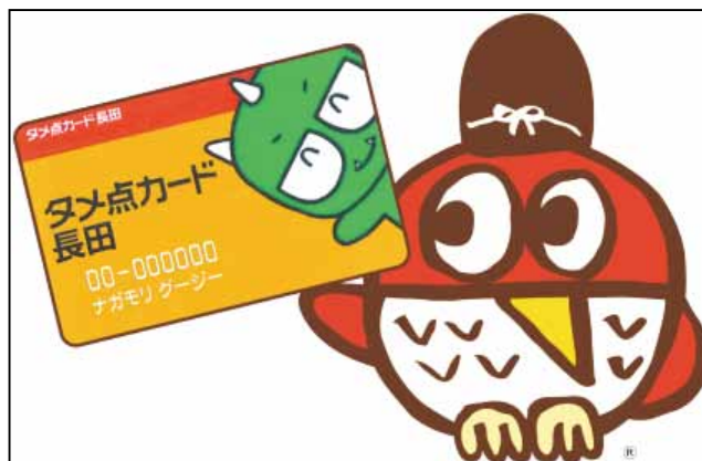
端数ポイントを地域活動に寄付できる「タメ点カード長田」