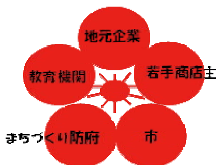
※実施体制イメージ図

また、理事長を中心とする商店街組織のほかに、各商店街の若手店主で結成された「和勝会(わかちあい)」が、新たな商店街活性化事業の提案を行っている。