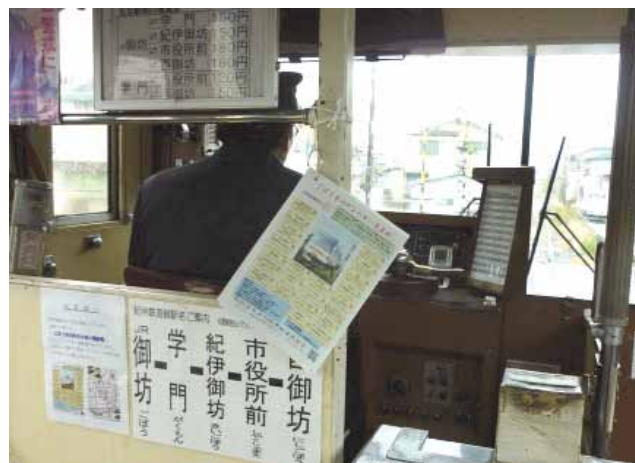
紀州鉄道と連携して商店街のクーポンチラシを配布