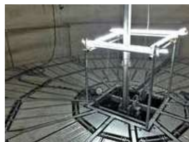
広い足場で安全に作業に取り組む

ステージタワーは工事の安全面でも大きな貢献をしている。広い足場が自動で上下するため、作業員の移動による落下の心配がない。常に上から作業ができ、穀物の落下による生き埋め事故も回避できる。さらに同社では、現場社員の安全確保のため、業務全体の変革も図ってきた。現場に必要な原材料、消耗品の購入、現場社員の移動に伴う飛行機や宿泊所の手配等、工事に関連する発注・支払い業務をすべて集約して原価管理者が行っている。この取組により、現場社員が安全作業に集中できる現場環境を生み出している。