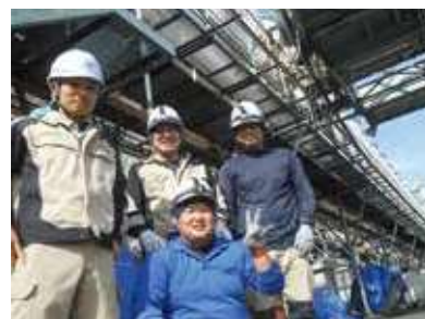
明るくやる気に満ちた社員

同社は、人材こそが企業の基盤であり、人材を育てることが工事情質、顧客の満足、企業の成長などすべてへ繋がると考えている。社員が安全でやる気をもって働ける環境づくりと、優秀な人材を育てる教育とに力を注いでいる。成田に社員寮を新築して生活環境整備に取り組み、年2回の個人面談での目標設定や、現場社員の管理部門へのローテーションにより、事業への参画意識が高い人材を育成している。また、海外展開を目指し、経済産業省の国際化促進インターンシップ事業により高度外国人材の受け入れも開始した。