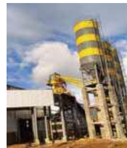
建設中のコンクリート製品生産工場

同社は現在、(株)武井工業所(茨城県)、小倉セメント製品工業(株)(福岡県)、トヨタ工機(株)(東京都)、Fuji Silvertch Concrete PVT Ltd(FSC)(インド)と共同で、近年発展が著しいインドにおいて、インフラ向けプレキャストコンクリート製品生産工場を建設中である。2022年に完成とともに生産開始を予定している。今後は国内の基盤を充実させるとともに、インドを足がかりにアジア地域の発展にも貢献することを目指す。