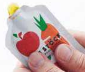
5年半保存可能なゼリー飲料

同社は2020年10月、(株)ワンテーブルと資本業務提携を締結。(株)ワンテーブルは宮城県を拠点として東日本大震災での経験をもとに展開している企業である。世界初の5年間保存できる防災備蓄食や災害時に必要となる食物繊維を含んだ健康食品などの商品の企画・販売を行っている。同社は(株)ワンテーブルと共同で北海道各地の地域の食材を原料として備蓄食、健康食品の開発を行い、北海道内各地、将来的にはアジア地域に展開し、自社の防災事業とのシナジー効果による付加価値向上を目指す。