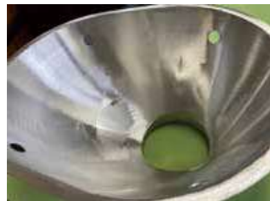
3D手板金加工製造品

同社はメンテナンス業で創業、大型船舶等、厳しい精度や厳しい品質管理が求められる受注にも対応してきた。こうした受注で培われた、ハンマー等の工具を使い流曲線のような微妙な立体形状を作り出す「3D手板金加工技術」、熱の影響が大きいアルミに100箇所を超える溶接を行いながら1mmの狂いもなく加工する「卓越した溶接技術」は、大手企業の量産型プレス加工では実現できない多品種・少量生産を可能とする。現在では船舶だけでなく、鉄道・高速バスに市場を広げ、国内のみならず海外でも採用されている。