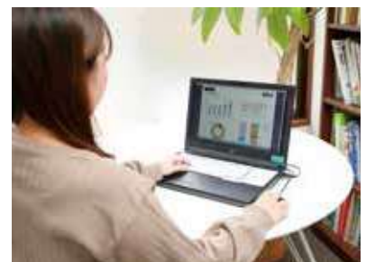
雇用調整助成金のeラーニング教育加算

グループ全体では設備稼働の最適化を図るため製造部門の統合（新会社で集約）を準備中である。全社員がウェブ事業に関する知識・スキルを習得すべくeラーニングを受講し、次の戦略に向けた全社あげての社内教育を進めている。独自開発した基幹情報システムによって全社員が業務情報をタイムリーに把握している。個人へ仕事を集中させない、自分で抱え込まないよう、チーム制を導入している。効率的なフレックス活用と休業を促進している。