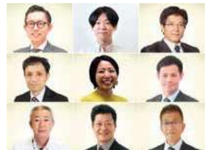
生え抜きのグループ会社の社長達

グループには、印刷、広告制作、ウェブ・動画制作等の会社があるが、各社の社長には主にアサプリで育った生え抜き社員を登用している。高いパフォーマンスを発揮すれば、社長にまで登りつめることができる仕組みを示すことで、社員のモチベーションアップに繋がっている。主婦、学生、外国人、シルバーの方等、多様な人材を採用している。社長子息3人が入社しており、先行きの事業承継に備え、経営管理（東京）、動画制作（東京）、営業・経営企画（大阪）と、それぞれ得意分野で活躍させ経験を積ませている。