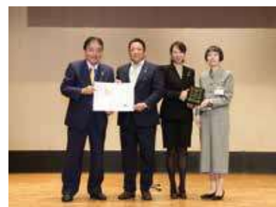
名古屋市女性活躍推進企業優秀賞受賞

男性社員比率が高い建設業のなかで、同社の女性社員比率は2割である。女性社員の活躍が評価されて、女性活躍企業のモデルとなっている。社内にたちあげた「Wプロジェクト」(WはWoman・女性の意味)では国土交通省のステップアップ支援事業を活用し、高機能・高性能の作業服を開発した。そしてオフィスから現場支援を行う新しい職域を作り出し、チームで現場を作りあげるといった全社員総活躍の実現を目指している。