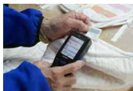
一つずつ番号があり、トレーサビリティも

次の施策により生産性を向上させている。①トレーサビリティ管理システム、異常発見管理システム、在庫管理システムの導入により、注文時、製造時の在庫管理や問題究明と工程改善が迅速化され、効率化が進んでいる。②自動停止・自動修復機能を有する最新機械も導入し、自社メンテナンスを行い生産の効率化を図っている。③作業者を多能工化し、一人三役制度を実施している。また、従業員の教育とポジションの交代制を導入し、工程間の平準化と生産性の向上を図っている。