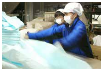
先輩が若い後輩を指導・育成

①従業員の6割、役職者の3割以上が女性であり、女性が働きやすい職場として短時間勤務制の導入や有給を取得しやすい環境づくりを行う等働き方改革を実践している。②社員の年齢層は幅広く在籍し、障害者も雇用しており、60歳定年後も希望者は継続して勤務してもらい、技術承継や若手従業員の育成の役割を担っている。③社員研修、資格取得費用は全額会社が負担しており、資格取得者には特別手当を支給し、従業員のモチベーション向上を図る等、自己研修や自主勉強会を推奨・支援をしている。