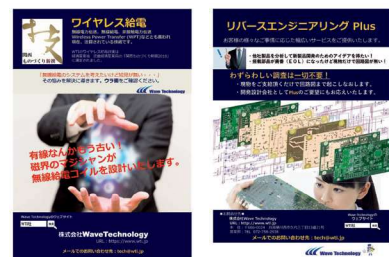
顧客目線のダイレクトメールで受注効率化