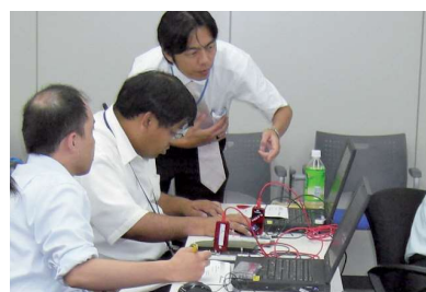
独自の教育システムで多様な人材を活用