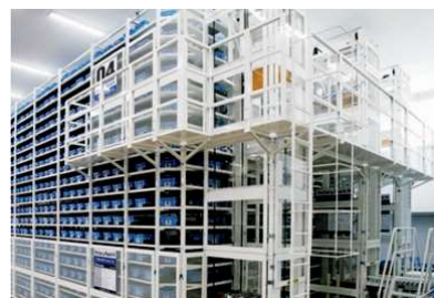
品揃えと即納体制の両立を実現

「顧客が求める多種多様なねじをワンストップかつ即日発送で提供」するビジネスモデルを人手をかけずに実現するために、早期よりITを活用して全商品のデータベース化により一元管理し、更に自動立体装置等の先端設備や高精度のピッキングシステムの導入を実施。商品発送の効率化・自動化及びピッキング精度の向上によって、100万超のアイテムの品揃えと即納体制を両立させ、顧客利便性の向上及び競合他社との差別化を実現して、幅広い顧客の獲得・商圏の拡大を進めている。