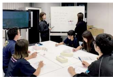
TQC活動による業務効率化の推進

先端設備の導入による商品発送の自動化・効率化に加えて、全社員の参加による「TQC活動」を実施し、品質管理と業務改善をテーマに議論を重ねてきた。本活動は既に71回を数え、例えば、顧客から生産中止となったねじの注文が入った場合に即座に代替品を紹介出来るようなデータベースの作成等、従業員が自発的に課題・改善策を提案するもので、先端設備導入と相俟って業務効率化を推進している。