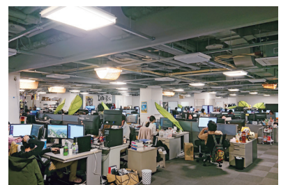
顔を合わせられるワンフロアのオフィス

高いレベルが求められるIT開発環境に身を置くことにより、プログラマの技術向上を実践している。スピード感が重要なプログラミング現場において、週1回ペースでの社内技術勉強会や新人同士によるブラッシュアップ勉強会によりそれぞれの技術レベルの向上に努めている。また、将来的に独立を考えているエンジニアの積極採用や、技術力が認められるアルバイト、契約社員の正社員への雇用変換も実施。