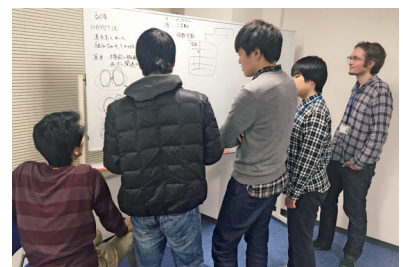
議論もコミュニケーションの場

フレックスタイム制で、個人の事情に応じた柔軟な働き方を推奨。また、チーム制で業務を進めることにより風通しの良い職場環境を構築し、職場内チャットを用いたコミュニケーションを活用しながら業務を進めることにより、社員がそれぞれの立場で業務への貢献を感じられるような経営を行っている。半年に一度、上司との打合せを通じて定期的に業務の進捗を確認。それにより、双方向の理解が高まり社員のモチベーション向上に繋がっている。