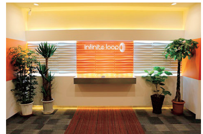
札幌本社エントランス

年齢・性別・学歴・国籍不問で社員を積極的に採用している。また、北海道へのU・Iターン採用を積極的に実施し、将来、独立を考えているエンジニアを歓迎。年齢や役職を排除して実力で勝負できるフラットな組織作りを常に意識している。また、実力・成果重視としながらも周囲の社員からの評価を反映する相互評価制度を採用して公平性にも配慮。雇用環境改善や働きやすい職場作りでも多くの取組を行っている。加えて無料の社内自動販売機、年4回の食事会、部活動等、福利厚生も充実させ、社内のコミュニケーションを円滑にしている。