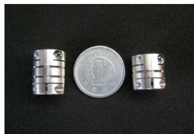
軸継手(カップリング)で高シェアを獲得

国内メーカー製のチップマウンターの大半には同社のカップリングが使われており、世界中で稼働しているこれらチップマウンターの多数に同社製品が組み込まれている。また、同社のカップリングは国内メーカーが手がける、半導体露光装置や半導体ウエハ搬送システムにも組み込まれており、中国、台湾や韓国を始めとした東南アジアの電子部品製造業界で広く使用されている。