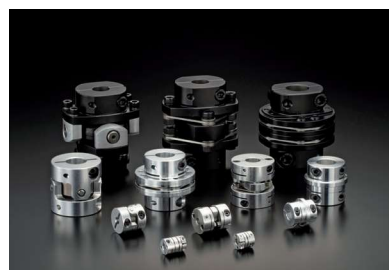
豊富な製品ラインナップのカップリング

ユーザーニーズに応える機能を徹底的に追求した設計・製造を行っている。カップリングは、目的・用途に合った特性のものを提供。なかには、耐磨耗性を追求するため、スペースシャトルの部品材料であるポリイミドを使ったものもある。また、一般的なカップリングが片側1本のボルトで軸を締めつけるのに対し、同社製品はボルトを2本にすることで、設置に際して軸心の振れが起きりにくい。こういったユーザーニーズに応えるべく、1つずつ従業員の手で製造している。