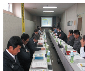
サポイン推進委員会の模様

ミニマルファブ規格に準拠した高速めっき装置を開発することで、多品種少量の半導体プロセスの製造コストを大幅に下げ、納期も大幅な短期化を実現した。また、本装置の開発により、世界最速クラスの新たな高速めっき条件を見出すことが出来た。これを従来製品のめっきプロセスへフィードバックすることにより、従来製品のめっきプロセスの高速化にもめどが立った。これによりさらに短納期・低コスト化による競争力の向上が可能になる。