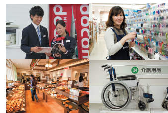
携帯ショップ・文具店・ベーカリーショップ・介護用品販売

従来はメーカーが作成した商品・サービスを顧客に提供していたが、自分たちのアイデアで商品を開発・提供したいとの思いからベーカリーショップをオープン。また、高齢化対応として介護用品等の販売・レンタルの他、安全・安心に不可欠な携帯電話や飲料水の宅配も行っている。こうした事業は、事務用品・OA機器等の顧客網を基盤としている。太陽光発電事業は、現資産を将来の安定したキャッシュフローに変換する事業と認識し、安定収益確保、健全な財務基盤の構築を行っている。