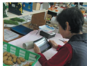
「農家直売システム」はタブレット端末で操作可能

入荷から販売、在庫、請求、支払、顧客情報までを一元管理できる「農家直売システム」を独自に開発・導入。購買者が簡単な操作で注文ができると同時に、生産者側も販売に関する業務を効率的に行えるようにしている。また、小規模農家の野菜を集荷するハブ拠点を広島県内に設置し、集荷・出荷業務の効率化を進めている。さらに、2019年には集配センターの移転・拡充を実施し、事業のさらなる効率化を図ることとしている。