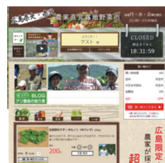
開設しているネットショップ

野菜は飲食店に届くまで一般に収穫から2、3日を要するが、同社では、農家が収穫した野菜を即時にネットショップに掲載できるようにするとともに、注文から24時間以内に配達する体制を整え、高鮮度の野菜を使いたいという飲食店の要望を実現した。同時に、少量多品種を栽培する小規模農家と連携し、約400種類の野菜・山菜類の出荷を実現。さらに単品の発注を可能とし、多様な野菜を求める飲食店のニーズに応じられるようにした。