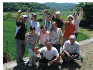
中山間地域活性化に貢献

中山間地域の小規模農家が生産する少量多品種の生鮮野菜を集約し、ネットショップを通じて生産地近郊の飲食店等にダイレクト販売する新たな野菜販売サービスを実施し、小規模農家が生産する野菜の流通額を大幅に増加させた。これにより、小規模農家の収入拡大と新規就農者の増加を促し、中山間地域の活性化に寄与している。また、同社の売上も順調に増加しており、ビジネスモデルとしても優れていることを証明している。