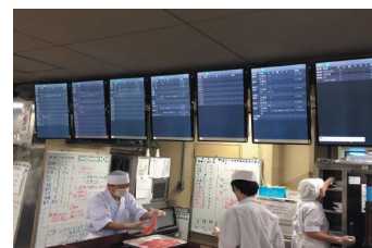
厨房内のデジタルサイネージで顧客の要望を情報共有

予約から客室管理、請求までを処理する IT システムの導入と活用により、厨房・配膳・各宴会場のパントリー内のデジタルサイネージに予約サイトや受付時の要望を反映できるようになった。また、接客スタッフ全員が携帯する業務用スマートフォンによる注文等の情報が瞬時に会計に反映されるようになった。従来に比べ、宿泊客の要望等を全スタッフが瞬時に共有できることにより、ミスや効率の低下を防ぐとともに、きめ細かな顧客対応が可能となり、顧客満足度の向上に繋がっている。