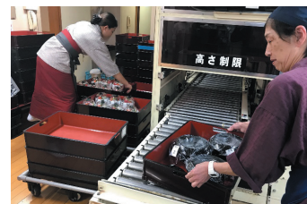
ローラーコンベアによる宴会場裏への食事運搬

重労働に従事する従業員の職場環境改善のため、施設改修や作業方法の改善活動を積極的に進めている。例えば、厨房から宴会場までの料理の運搬をローラーコンベアで運び、宴会場ではお座敷台車を活用して料理のセッティングを行っている。お座敷台車導入のために段差を無くし、台車が通る出入り口の間口を拡張する等の改修を行うことで、従業員の負担が減り作業効率が倍増、宴会の準備時間が大幅に短縮した。裏動線についても、台車を押しのまま通れるように、ドアは自動ドア化している。