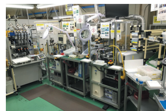
自社製作のコイル製造ライン

客先の設計開発部門と連携して、同社の製造現場や客先ニーズに合わせた設備開発を行うことで、開発から量産準備や量産工程の業務効率化につなげている。さらに量産後も生産技術力を活かして継続的にカイゼンを行っており、客先へ生産性・品質安定性の提案を行うことで、WIN-WIN の関係を維持する取組を実行している。