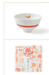
萬古焼、伊勢木綿を使った商品例

商店では、三重の食・工芸の企業とコラボしたお土産づくりに尽力。伊勢を元気にするという思いから、統一的なブランドコンセプトを確立。このブランディング [伊勢 ゑびや] は 2017 年グッドデザイン賞を受賞。