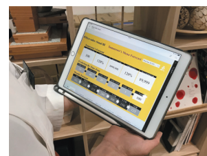
来客予測と視覚化

2017年10月に、これまで専務であった現社長に代替わり。伊勢という地域の歴史から、老舗飲食店 [伊勢 ゑびや] のブランドを再定義。地域や伝統といった老舗ならではの要素を継承しながらも、ビッグデータを活かした来客予測や、AI・IoT等の最新のIT技術を積極的に導入。専務時代からのリーダーシップを持って、伝統×最先端技術の両面から、数字の視覚化等の業務効率の向上を重視した経営革新に精力的に取り組んでいる。