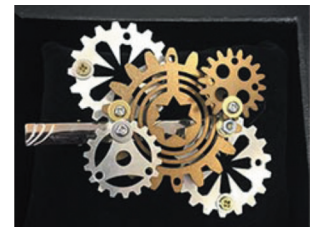
開発したネクタイピン

新事業として、「スチームパンクの世界観を取り入れたアクセサリ」の開発に着手。既存にない市場への挑戦、同社初の BtoC 事業として、新たな販路開拓を通じて会社知名度を向上し、本業まで活気づけている。製品開発を行い、スチームパンクイベント等に出店、自社工場の空きスペースをショールームにするなど様々な取組により注目を集めている。マスコミなどに多く取り上げられたことにより、本業への受注にも繋がり成果を上げている。