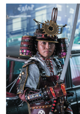
プロジェクトに参加した従業員をモデルに広報を実施

スチームパンク事業では、従業員の資質向上、モチベーションアップも大きな目的としている。この事業を実現するため、スキルを持った女性フリーランスを擁するコトリスラボの協力を得て、「ダイカスト男子プロジェクト」と銘打ち、ダイカストの現場で働く若手社員をメンバーとした。アクセサリ商品の企画、開発、製造や広報、販売まで自分たちで行うことで、通常は表に出ることのない現場作業者が新たな発想を持って積極的に行動するようになり、成長に繋がった。