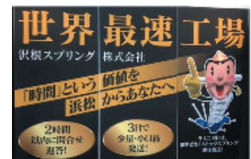
同社のミッション

量産リピート品の価格競争から、小ロット品の生産販売で時間という価値を売っている時間提供業と捉え、スピードとサービスに磨きを、作り方の見直しやITの活用を積極的に行い、受注生産品でも適正価格で供給できるようになった。製造業でありながら自ら製造小売業と称し、製造業のサービス業化を進め、「考え・作り・売る」をバランスよく実践している。毎日違った図面を見て作ることで、考える人材の育成にもつながっている。