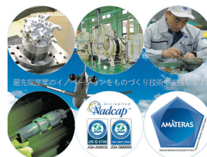
社内一貫加工と中小企業連携

また、自社内での取り組みにとどまらず、複数の中小企業と連携体 AMATERAS を組織し、社外工程も含めた完成品の一貫加工を目指すなど、新たな付加価値の創出に挑戦している。