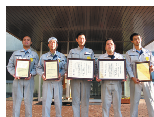
国家技能資格取得者

会社全体のマネージメントとして人材育成、技能の維持・発展を位置づけ、教育訓練実施要領を制し、課題を年ごとにまとめて業務改善のPDCAに生かしている。個人の技能レベルを客観的に評価する指針の一つとして国家技能資格の取得を啓蒙しており、就業規則にも計画的に受験させる旨規定する事で、個人の資格取得を会社活動の一つとしている。また、技術の育成に加え、若手管理者・次期管理者候補へのリーダー教育にも注力し、外部講習・コンサルタント等を活用している。