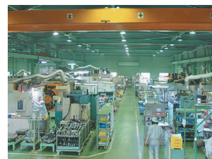
メイン工場生産現場

精密機械加工、真空熱処理や非破壊検査などの特殊工程、ユニットの組立て・修理作業という3つの事業を柱として、厳しい品質管理の下、社内一貫体制で顧客に付加価値の高い製品・サービスを提供することで他社に対する優位性と差別化を実現し、特に航空宇宙機器・高速鉄道車両・電力発電装置など高精度・高品質が要求される産業の重要機能部品・重要保安部品において、国内大手メーカーからの高い評価と確固とした地位を築き上げている。