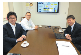
会計事務所との経営・承継打合せ風景

今後、既存顧客との信頼関係の更なる強化に取り組むことで、営業範囲の拡大を目指している。