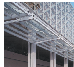
フオリオアップドア(OPAM)

同社は創業当初から、常に新しい製品へのチャレンジを続けてきた歴史的背景がある。創業者の卓越したリーダーシップのもと築いてきた人的資産(経営管理力、工場運営力)、組織資産(技術力、経験値、内製優先思想)、関係資産(大手シャッターメーカー・商社等受注先、設計事務所・電装制御盤メーカー等協業先)を継承しつつ、水害対策用の床止水板、美術館向け特殊扉(折戸)の製作等、新事業を立ち上げている。