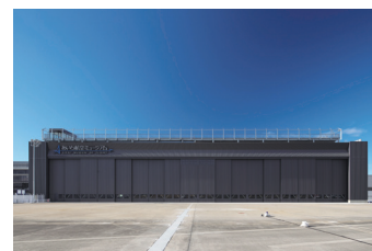
あいち航空ミュージアム

同社は、大型扉・特殊扉、放射線防止ドア、防潮扉、焼却ピットドア、カーテンウォール、大型防音ドア、燻蒸ドア等、数々の製品を開発、製造販売してきた。長年に亘りフルオーダーの一点ものを受注生産していることから、大型・特殊扉に関して相当高い技術力を有している。